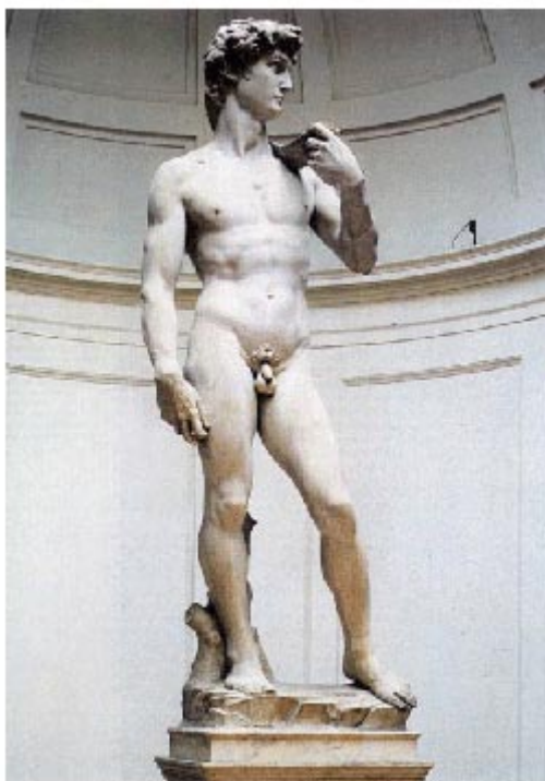
David de Miguel Ángel. 1501-1504