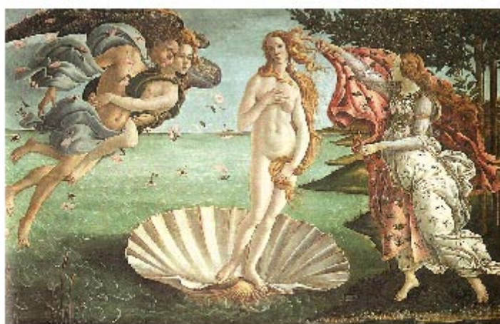
El Nacimiento de Venus. Botticelli. 1485