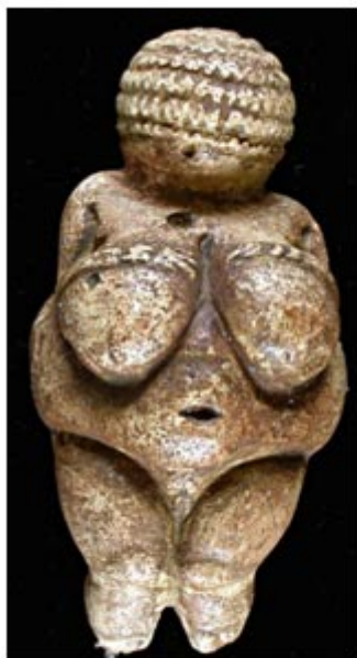
Venus de Willendorf 30.000 a. de C.