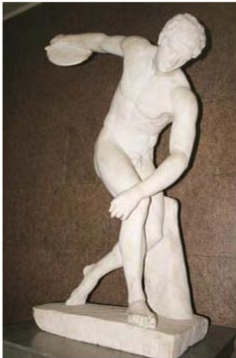
Discóbolo de Mirón 450 a. de C.