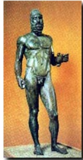
Guerrero de Riace 460 a. de C.