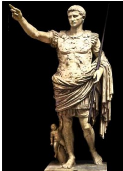
Augusto de Prima Porta 20 a. de C.