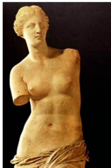
Venus de Milo (II a. de C.)