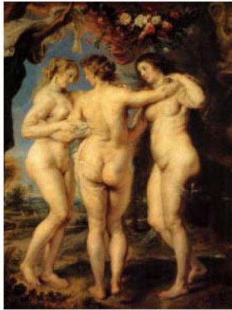
Las tres gracias. (1639) Rubens

Esta cabeza, cuando viva, tuvo sobre la arquitectura destos huesos carne y cabellos, por quien fueron presos los ojos que mirándola detuvo. Aquí la boca de la rosa estuvo, marchita ya con tan helados besos, aquí los ojos de esmeralda impresos, color que a tantas almas entretuvo. Aquí la estimativa en que tenía el principio de todo movimiento, aquí de las potencias la armonía. ¡Oh, hermosura mortal, cometa al viento! Donde tan alta presunción vivía desprecian los gusanos aposento.