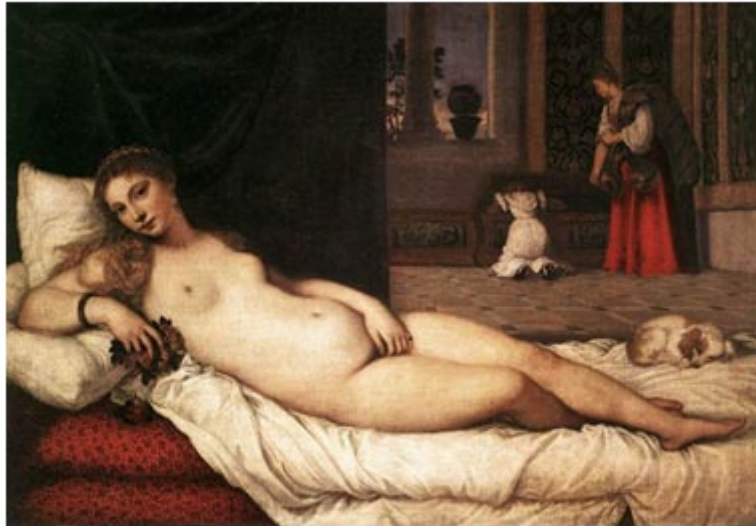
Venus de Urbino (1539) . Tiziano

"Amantes, no toquéis, si queréis vida, porque entre un labio y otro colorado, Amor está, de su veneno armado, cual entre flor y flor, sierpe escondida"