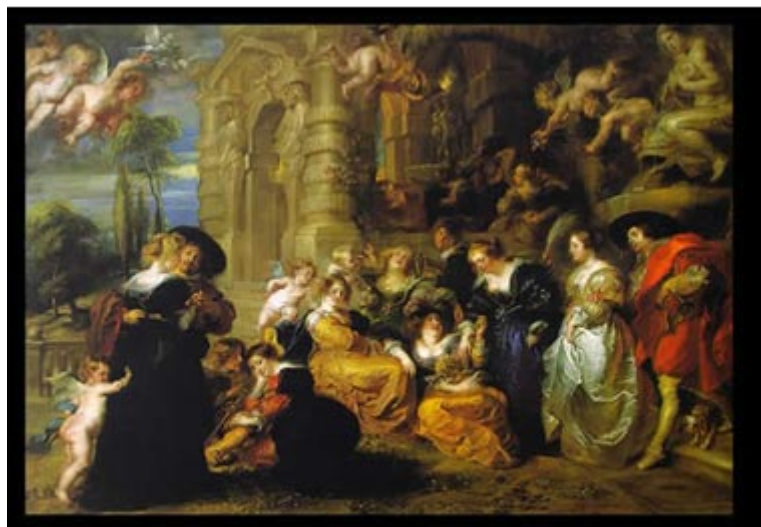
El jardín del amor. P.P. Rubens.