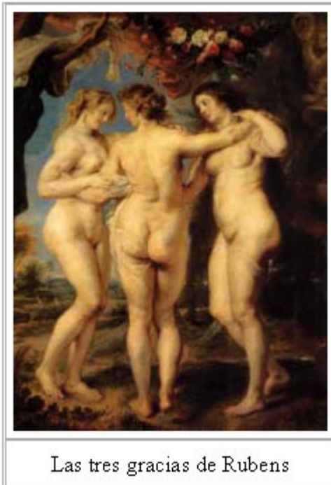
Las tres gracias de Rubens